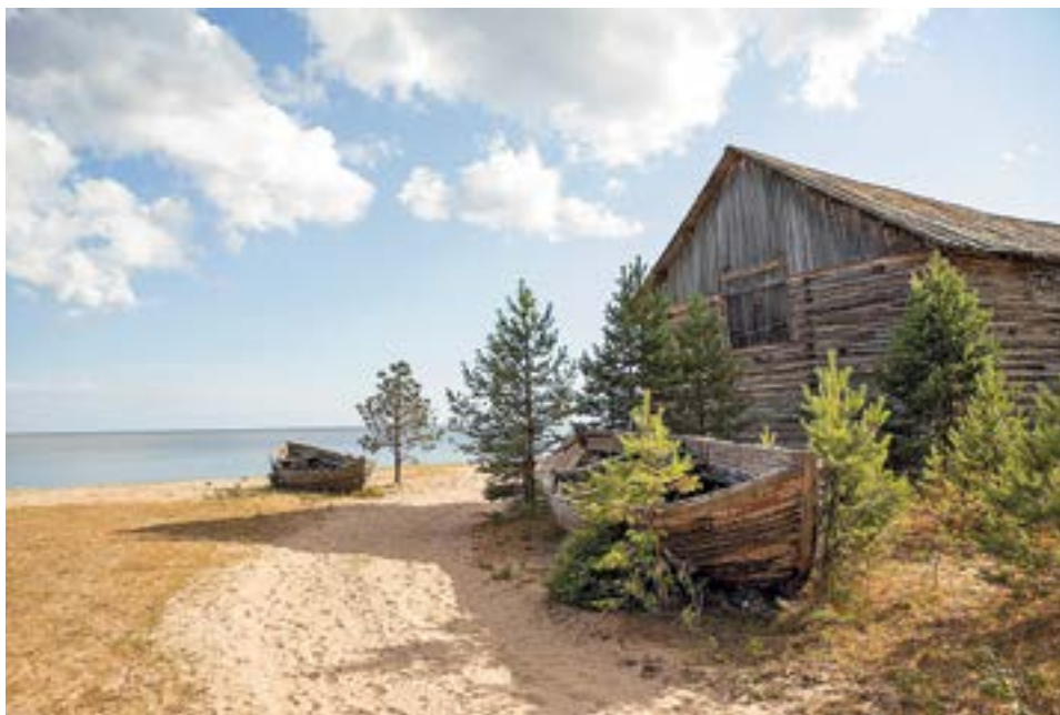
РИСУНОК 7. РЫБНЫЙ АМБАР НА БЕРЕГУ БЕЛОГО МОРЯ, С. ПУРНЕМА, ОНЕЖСКИЙ Р., НАЧ. XX В.

но-рядовой формой застройки [9]. Длина поселения ок. 2 км. Окна домов обращены на южную сторону, реку и море и имеют хорошее освещение. Для Пурнемы характерен комплекс дома-двора типа «брус» с высоким подклетом. Жилая часть — четырехстенки, изредка встречаются пятистенки с 3-6 окнами по главному фасаду [13, с. 123–124]. Сбор и систематизация данных позволяют рекомендовать для