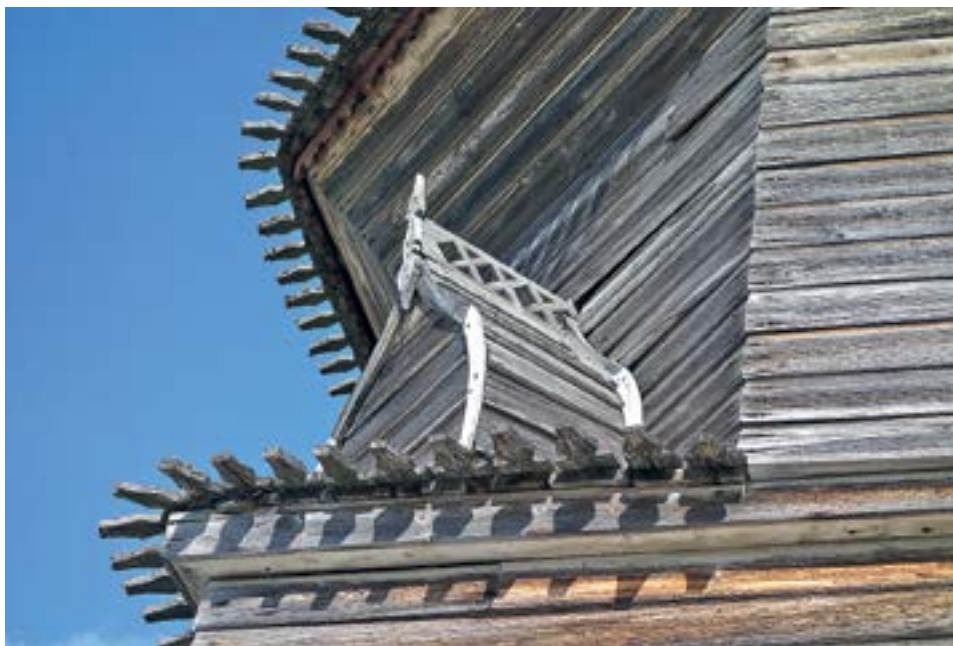
РИСУНОК 6. РЕЗНЫЕ КОКОШНИКИ НИКОЛЬСКОЙ ЦЕРКВИ, С. ПУРНЕМА, ОНЕЖСКИЙ Р., 1618.

Роща «Кендище» занимает узкую полосу суши между морем и рекой, здесь находится «кладбище карбасов», рыбные амбары [16].