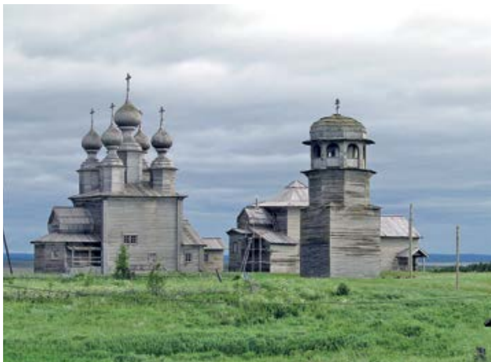
РИСУНОК 9. КУЛЬТОВЫЙ АНСАМБЛЬ С. ВОРЗОГОРЫ ОНЕЖСКИЙ Р.: НИКОЛЬСКАЯ ЦЕРКОВЬ (1636), ВВЕДЕНСКАЯ ЦЕРКОВЬ (1793), КОЛОКОЛЬНЯ (1862).

Ворзогорский приход существует с 1578 г. [22, с. 13]. Никольская (летняя) церковь (1636) — высокий сруб, перекрытый четырехскатной кровлей с 5 восьмигранными барабанами, крытые небольшими овальными куполами, через шейки, плавно переходящие в изящные лемеховые главки. Это редко встречающийся декоративный прием оформления храма [23, с. 97].