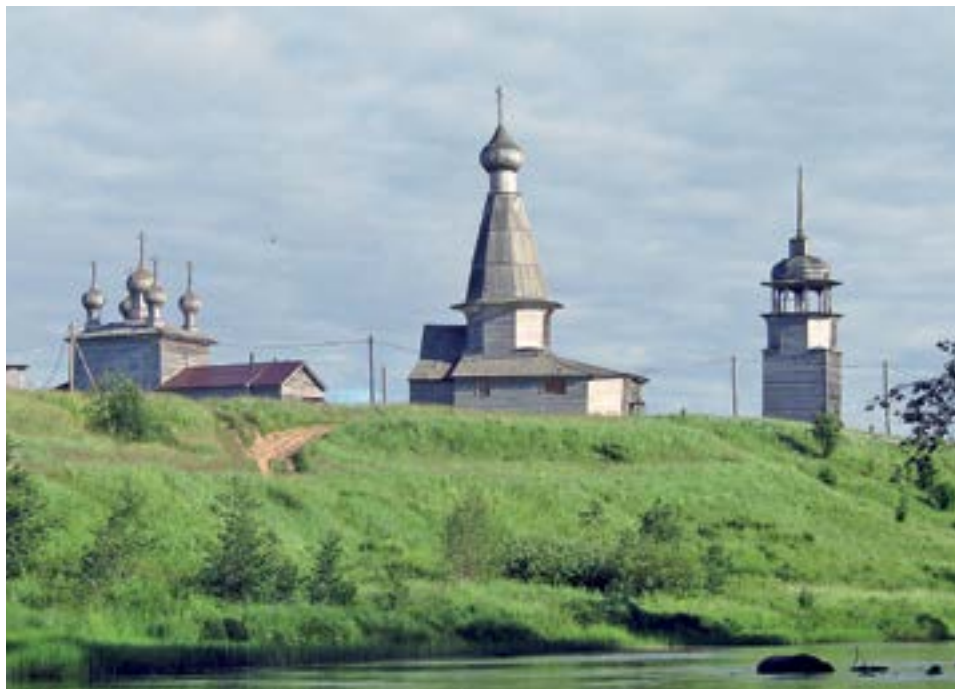
РИСУНОК 8. КУЛЬТОВЫЙ АНСАМБЛЬ С. МАЛОШУЙКА, ОНЕЖСКИЙ Р.: СРЕТЕНСКАЯ ЦЕРКОВЬ (1873), НИКОЛЬСКАЯ ЦЕРКОВЬ (1638), КОЛОКОЛЬНЯ (1807)

Холмы играли важную роль в формировании сакрального ландшафта поселения, на них устанавливались утраченные к настоящему времени деревянные кресты [18, с. 78]. На одной из таких возвышенностей, на правом берегу реки, располагается культовый ансамбль.