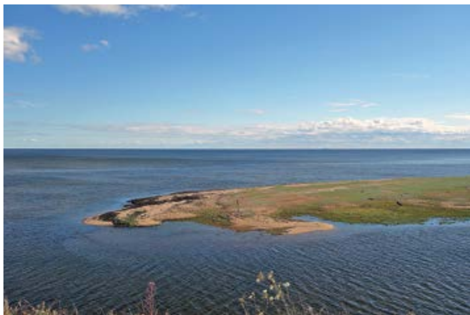
РИСУНОК 2. ОНЕЖСКОЕ ПОМОРЬЕ.

В процессе работы использовались методы этнографического интервью, архитектурно-этнографического обследования памятников архитектуры, исторических поселений с проведением фотофиксации и схематических обмеров. Исследование опирается на применение двух авторских методик [3–5]. Историко-архивный метод и метод музейных практик использован при работе в архивах, музеях: Москвы, Санкт-Петербурга, Архангельска, Онеги и др.