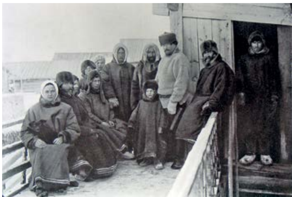
РИСУНОК 1. ПОМОРЫ. ФОТО ИЗ ФОНДОВ РОССИЙСКОЙ ИСТОРИЧЕСКОЙ ПУБЛИЧНОЙ БИБЛИОТЕКИ, КОН. XIX В.

Русский Север — особый регион российского культурного наследия, по своей значимости он соотносим с уникальными явлениями мировой культуры. На его территории расположены памятники, представляющие Россию в списке объектов всемирного культурного и природного наследия, сформированного под эгидой ЮНЕСКО. В эпоху всеобъемлющей глобализации и унификации все большую ценность обретают национальная и культурная самобытность. Среди регионов страны именно Русский Север во многом сохранил уникальность культуры и традиций русского народа.