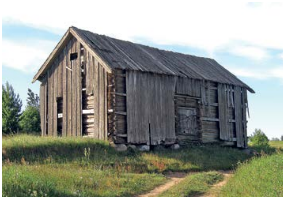
РИСУНОК 11. АМБАР-МАНГАЗЕЯ, С. ВОРЗОГОРЫ, КОН. XIX В.

Объекты туристического показа, имеющие историко-культурную ценность: