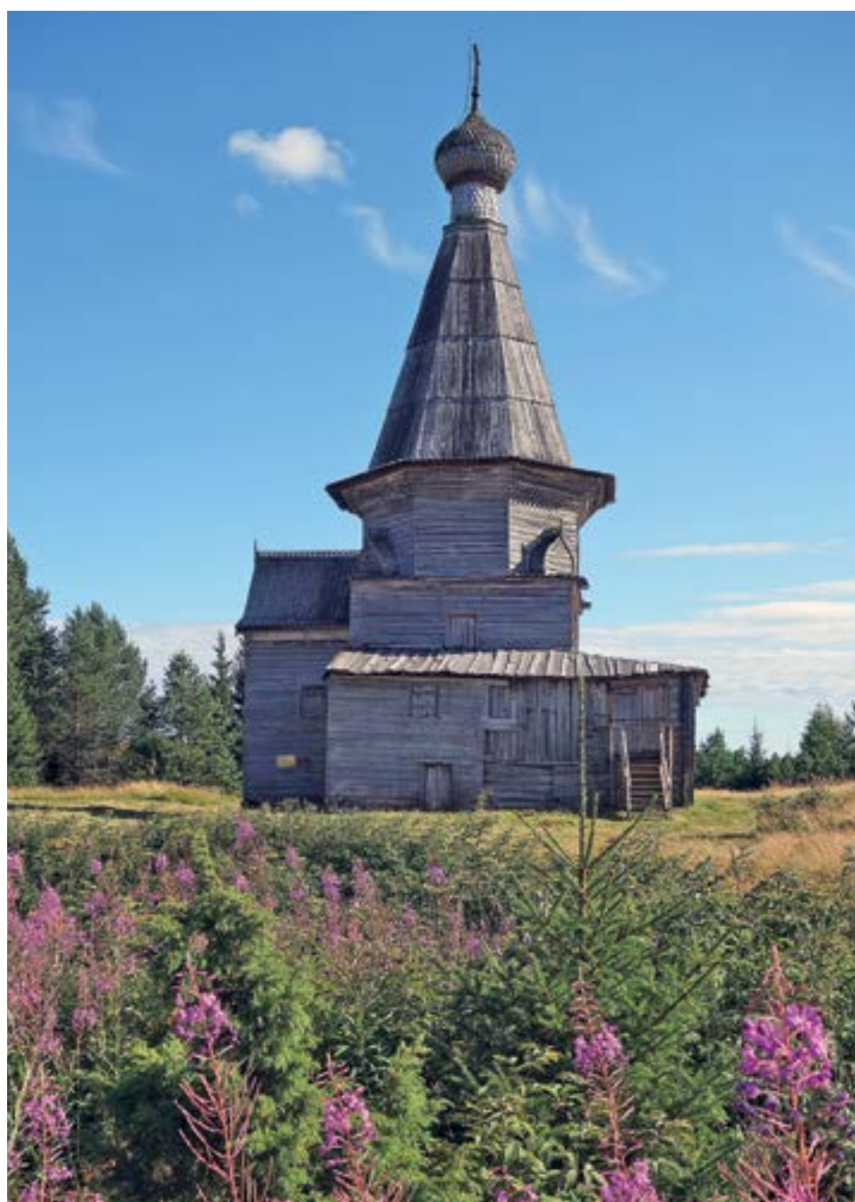
РИСУНОК 4. НИКОЛЬСКАЯ ЦЕРКОВЬ, С. ПУРНЕМА, ОНЕЖСКИЙ Р., 1618.

Пространственная организация села строилась вокруг погоста, в состав которого входили две церкви, колокольня, роща, церковно-приходская школа, амбар-магазея,