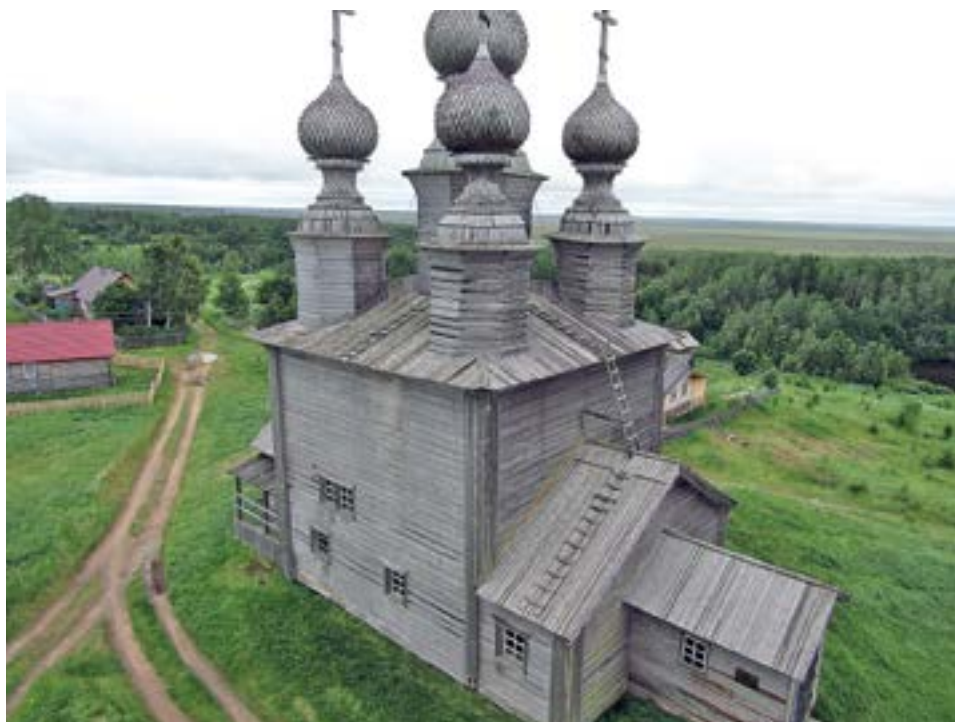
РИСУНОК 10. НИКОЛЬСКАЯ ЦЕРКОВЬ, С. ВОРЗОГОРЫ, 1636. ФОТО А. УСОВА

Ворзогорский приход существует с 1578 г. [22, с. 13]. Никольская (летняя) церковь (1636) — высокий сруб, перекрытый четырехскатной кровлей с 5 восьмигранными барабанами, крытые небольшими овальными куполами, через шейки, плавно переходящие в изящные лемеховые главки. Это редко встречающийся декоративный прием оформления храма [23, с. 97].