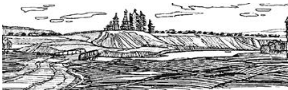
РИСУНОК 3. ПОГОСТ С. ПУРНЕМА. РЕКОНСТРУКЦИЯ Ю. С. УШАКОВА, 1982

Поморский дом благодаря выработанным местными зодчими принципам планировки, архитектурно-конструктивного устройства и декора выступает как этнический механизм адаптации русских в процессе освоения северных и арктических территорий