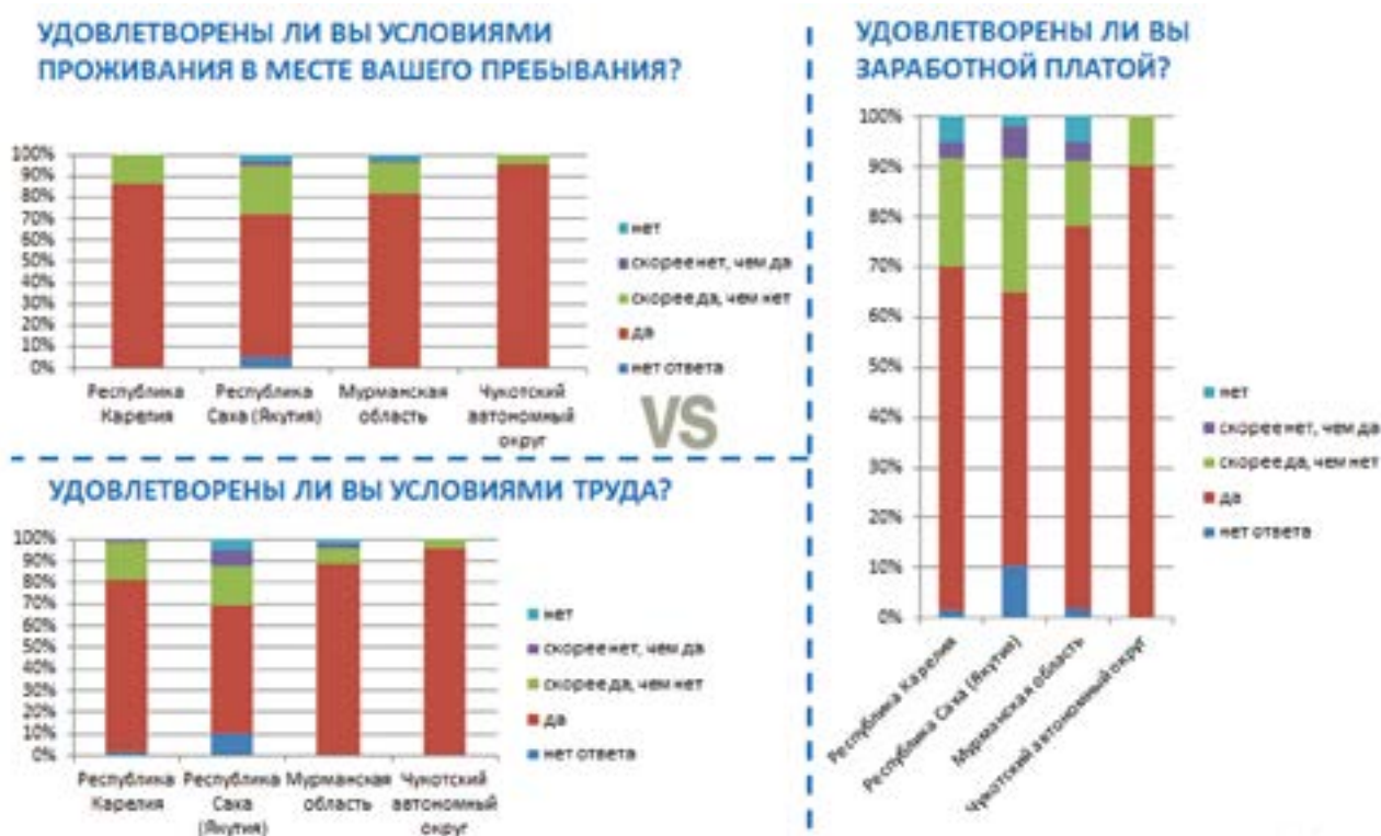
Рисунок 1. Качество жизни трудового мигранта в Арктике

Зарубежный трудовой мигрант на региональном рынке труда в Арктике представляет особенный интерес. Как следует из рисунка 2, в три обследуемых субъекта (Республика Каре-