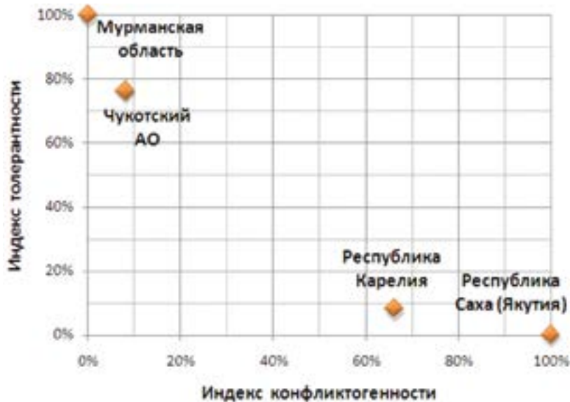
Рисунок 3. Индекс конфликтности и Индекс толерантности субъектов Арктики по оценкам принимающего населения

Исследование показало, что с точки зрения межнациональных отношений в субъектах Арктической зоны России всё относительно спокойно. Результаты проекта нашли большой отклик в регионах Арктики. Результаты опросов трудовых мигрантов вызвали большой интерес в исследуемых субъектах и были направлены в региональные органы власти для ознакомления. Не вызывает сомнения, что исследования, связанные с этой тематикой, играют важную превентивную роль, и должны обязательно развиваться.