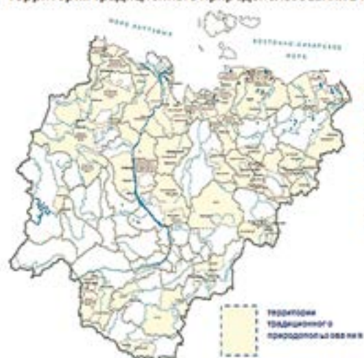
Территории традиционного природопользования в РС(Я)

Понятие «оленьи пастбища» исключено из ГОСТ 26640-85 «Земли. Термины и определения».