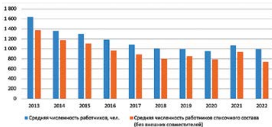
РИС. 3. СРЕДНЯЯ ЧИСЛЕННОСТЬ РАБОТНИКОВ, ЗАНЯТЫХ В ОХОТНИЧЬЕМ ХОЗЯЙСТВЕ, ПО РЕСПУБЛИКЕ САХА (ЯКУТИЯ) ЗА 2013–2022 ГГ., ЧЕЛ.

Рентабельность заготовки пушнины, как показала практика, является труднопрогнозируемой